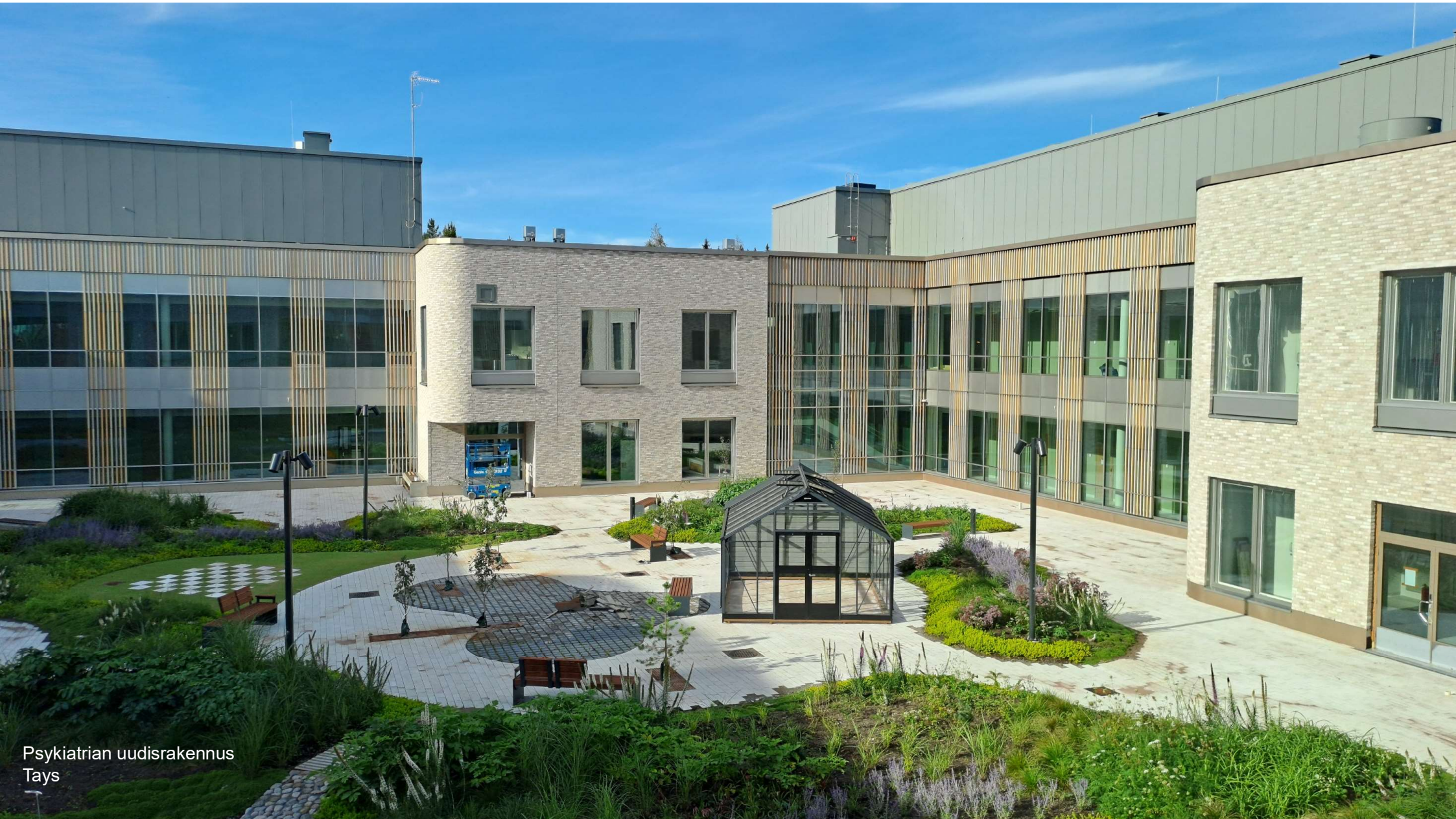
Psykiatrian uudisrakennus Tays